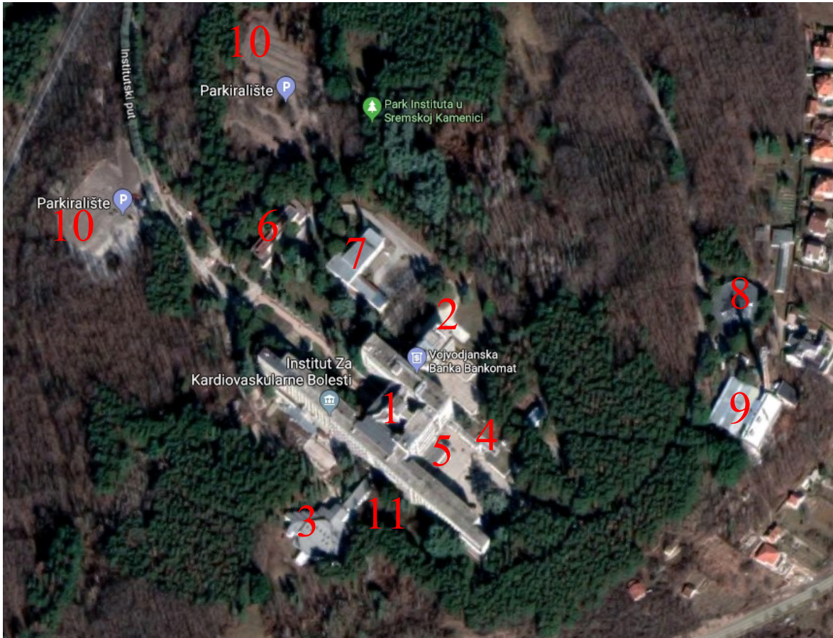
-Комлекс Института_Сремска Каменица-