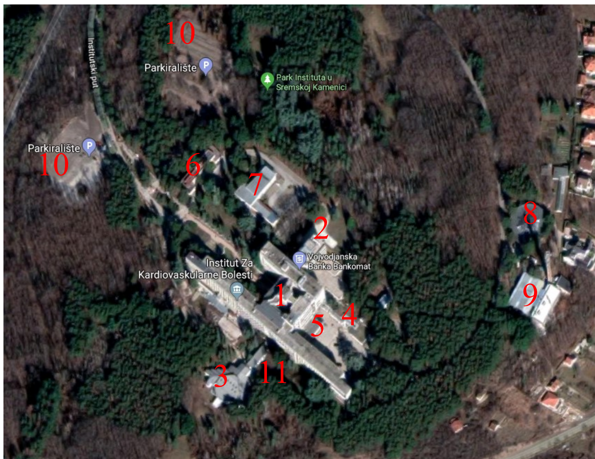
-Комплекс Института_Сремска Каменица-